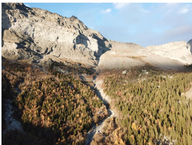
Le Nant Bordon

Le SM3A, autorité GEMAPI – Gestion des Milieux Aquatique et Prévention des Inondations – sur le bassin versant de l'Arve réalise à un aménagement hydraulique du Nant Bordon, destiné à protéger les personnes et les biens.